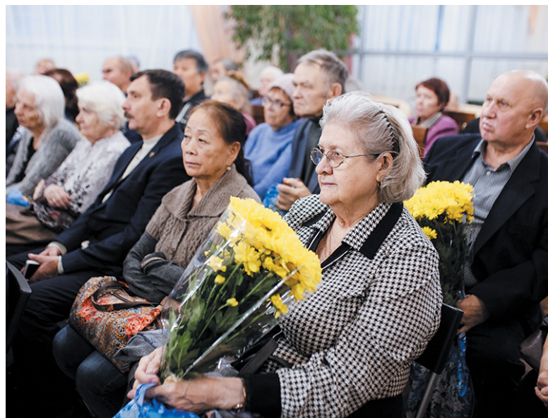
Их семьи прошли через сталинские репрессии