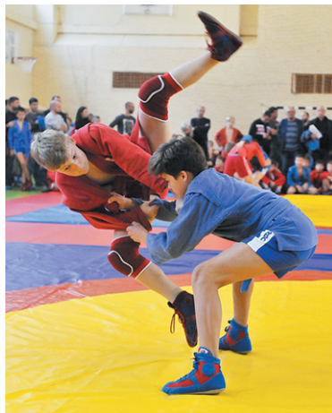
За такой бросок – четыре балла