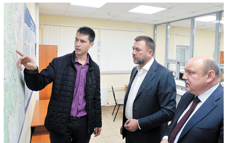
Скорая помощь в ТиНАО: существующее положение и развитие сети

Депутат поинтересовался графиком работы, уровнем заработной платы специалистов, принципами выбора медучреждения, куда скорая везёт больного, и с какими случаями чаще всего обращаются граждане. Оказалось, что зарплаты значительно выше, чем в Московской области, но до столичного уровня всё же не дотягивают. Что касается причин