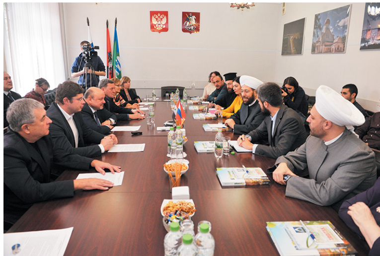
Начало визита. Делегация из Сирии в администрации Троицка

Поблагодарить за помощь и наметить пути дальнейшего сотрудничества – таковы цели визита сирийской делегации в Троицк. Иностранные гости посетили наш город 26 октября. Среди них – верховный муфтий Сирийской Арабской Республики Ахмад Бадр-эд-Дин Хассун. Общий состав делегации – 12 человек.